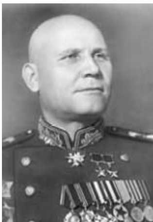
Конеv И.С. Командующий фронтом

По итогам операции 24 части и соединения были удостоены почётного наименования «Кировоградских», ещё ряд подразделений был награждён орденами. Враг понёс тяжёлые потери – 5 дивизий потеряли от половины до трёх четвертей личного состава, и огромное количество техники. Потеря Кировограда, являвшегося важным коммуникационным узлом, привела к потере прежней прочности обороны 8-й армии вермахта. В дальнейшем перегруппировка войск на освобождённых территориях позволила начать успешную Корсунь-Шевченковскую операцию, обернувшуюся тяжёлым поражением немецких войск.