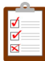
информационные листы и объявления